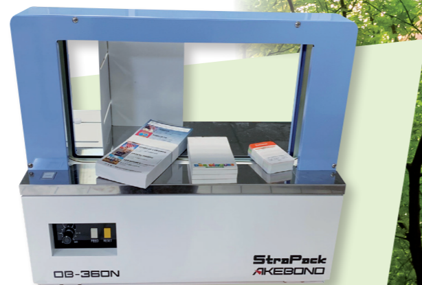
Emballage bande papier