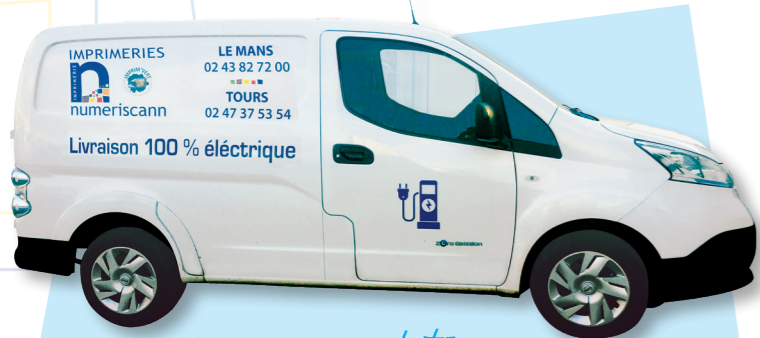
Livraison 100% électrique

Sur huit véhicules de la société, seul 1 reste en diesel. Chaque année nous remplaçons un véhicule diesel par un véhicule électrique ou hybride essence . Ce qui fait qu'en 2021 nous aurons atteint notre objectif zéro diesel au sein de nos imprimeries.